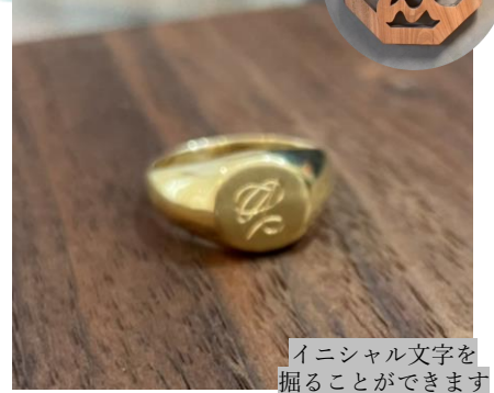
イニシャル文字を掘ることができます