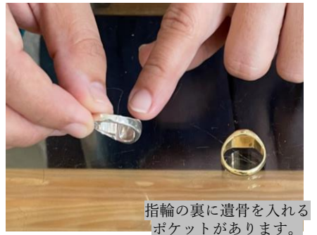
指輪の裏に遺骨を入れるポケットがあります。