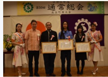
永年勤続優良従業員表彰