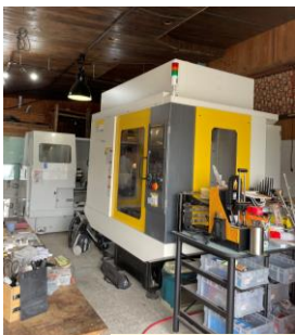
電流が流れているためどんな硬い金属でも切断できる