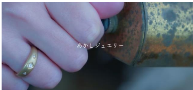
あかしジュエリー

何よりも、生きてる時に考えておくことで、今を一生懸命生きることシフトチェンジできるのではないかと考えています。