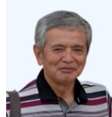
當山 與市郎 理事 當山マンゴー農園