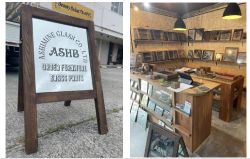
ショップにはパブミラーやショーケースがたくさん並んでいます。