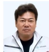
德里 隆行 理事 株式会社常進建設