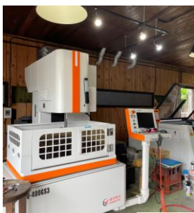
分厚い金属の切断や削り加工ができる